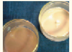
お客様のお肌の状態に合わせて、数種類の温泉泥から選びます。

世界的な鉱泥集積地である別府八湯で採取された、良質の温泉泥を使った「別府八湯ファンゴティカ」であなたも美肌に。温熱効果で体の老廃物を取り除き、肌のきめを整えます。元となる温泉泥は天然の泥100%なので、アレルギーなどの心配もありません。温泉入浴をプラスすれば、更に効果が高まります。天然温泉力をぜひ体感してください。